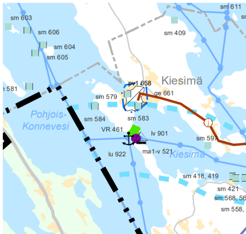
Kuva 2: Ote Pohjois-Savon maakuntakaavayhdistelmästä.