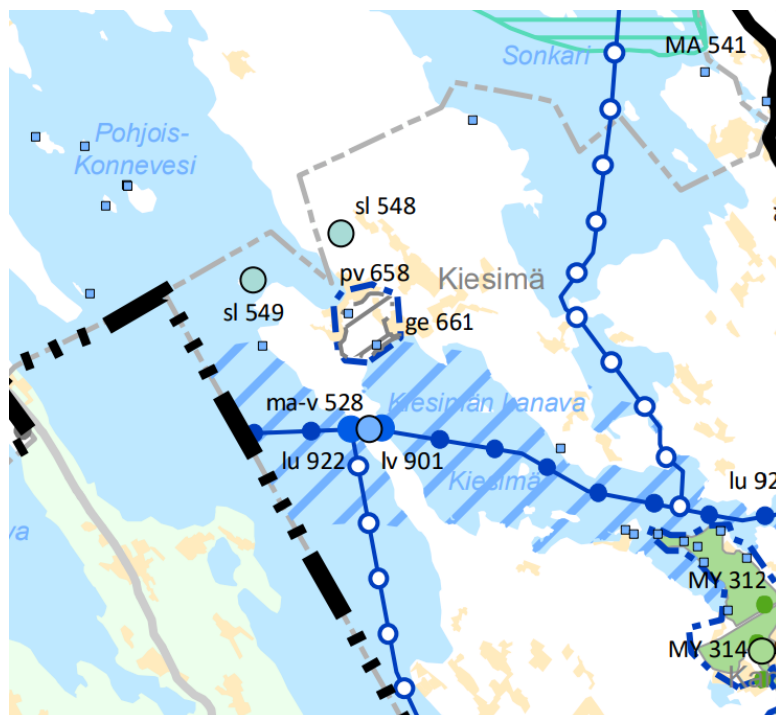
Kuva 3: Ote Pohjois-Savon maakuntakaava 2040 2. vaiheen ehdotuksesta.